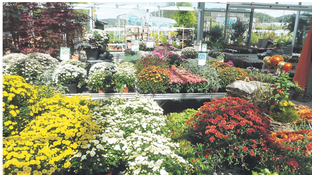
Im Hauenstein Garten-Center in Rafz bietet sich eine traumhafte Auswahl an bunten Herbstpflanzen.

Weitere Informationen: Hauenstein Garten-Center Imstlerwäg 2 (beim Kreisel), 8197 Rafz Tel. 044 879 11 60, www.hauenstein-rafz.ch